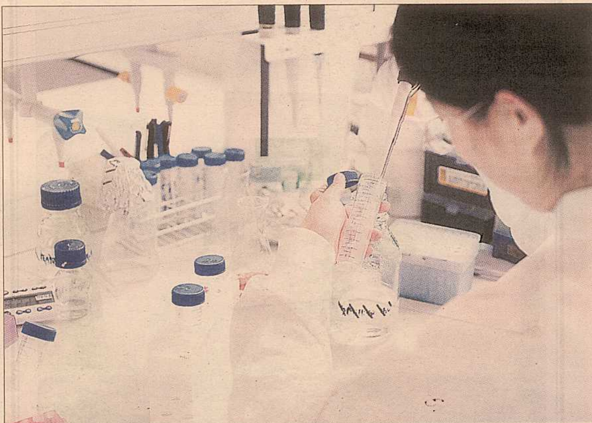
Una investigadora manipula muestras de ADN en el laboratorio de Vitagenes en Granada.

Además, se centra también en otros aspectos más relacionados con la estética, como el envejecimiento celular, la alopecia o la obesidad y el control de peso corporal. La propuesta, aunque aún no ha salido al mercado, cuenta con gran expectación. “Tenemos ya más de 2.000 clientes